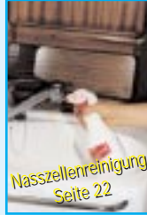
Nasszellenreinigung Seite 22

Die vielen Kunststoffflächen in den Nasszellen sind immer schwer sauber zu halten. Wir empfehlen Ihnen daher unseren Bad & Waschbecken Reiniger. Dieser eignet sich hervorragend, um ohne Kraftaufwand, alle Oberflächen in den Badezimmern zu säubern. Einfach aufsprühen, kurz einwirken lassen und mit feuchtem Tuch nachwischen oder mit Wasser abspülen. Anschließend strahlt die Oberfläche. Kalkflecken und Seifenreste sind verschwunden.