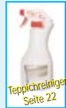
Teppichreiniger Seite 22

Auf Teppichen und Polster kommt es immer wieder zu unansehnlichen Flecken. Diese lassen sich sehr gut mit unserem Teppich & Polster Reiniger entfernen. Das Mittel wird am Besten auf einen nassen Schwamm oder auf den Fleck direkt gesprüht. Durch mehrmaliges Zusammendrücken des Schwammes erzeugen Sie Schaum, mit dem Sie dann den Fleck bearbeiten. Anschließend über Nacht trocknen lassen und absaugen.