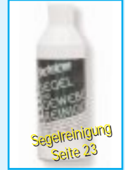
Segelreinigung Seite 23

Wer die Möglichkeit hat, sollte das Segel abschlagen und zu Hause in der Badewanne reinigen, alle anderen sollten das Segel auf eine saubere Unterlage legen und mit Reiniger abschrubben. Bei hartnäckigen Stockflecken empfehlen wir unseren Schimmelentferner, siehe Stockflecken, Schimmel und Algen.