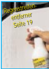
Regenstreifen-entferner Seite 19