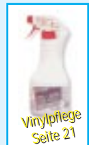
Vinylpflege Seite 21

Kunstleder-Polster und Bezüge verschmutzen im Laufe der Zeit zunehmend und verlieren Ihren Glanz und die Geschmeidigkeit. Zum Reinigen empfehlen wir Ihnen unser Vinyl Shampoo. Einfach unverdünnt auf einen feuchten Schwamm geben und das Polster so lange putzen, bis der Schmutz vollständig entfernt ist. Um den Stoff gegen Neuverschmutzung zu schützen und wieder glänzen zu lassen, sollten Sie anschließend unsere Vinyl- & Kunststoff Pflege aufsprühen und mit einem sauberen Tuch einarbeiten.