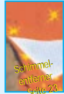
Schimmel-entferner Seite 23