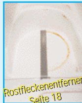
Rostfleckenentferner Seite 18

Meistens sind Bohrspäne oder unedle Schrauben daran Schuld, daß sich auf dem Kunststoff Rostflecken befinden. Diese Flecken können mit dem Produkten Rost & Kalk Entferner, sowie Anti Gilb beseitigt werden. Einfach auftragen, einwirken lassen und mit Wasser nachspülen.